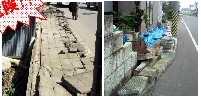
一般財団法人 消防防災科学センター (災害写真データベース)