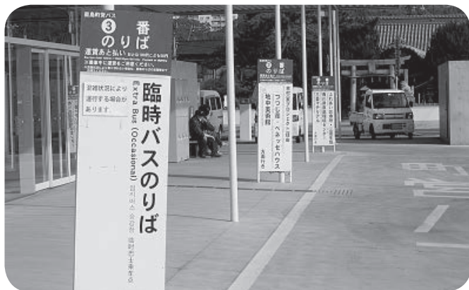
海の駅標識が変わります

議会を傍聴しませんか 次の議会は、 9月 に開催されます。 傍聴の手続きは、役場3階議場傍聴席受付で住所・氏名等を記入するだけです。 議会事務局 (☎892-2297)