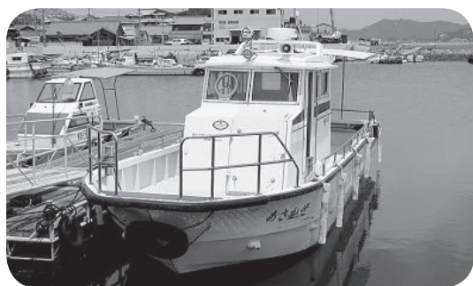
修繕したスクールボート

スクールボートの故障により、修繕料および修繕の間の船舶借上料として186万円を専決処分しました。