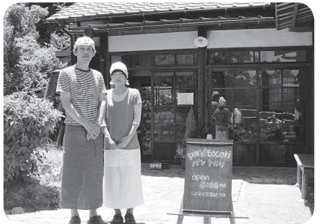
パンを買いに来てね!

「パン・トコリ」さんのお話をお伺いして、とても幸せな気持ちになりました。いつまでも、いつまでも直島の名物「パン・トコリ」を続けていって下さい。 お忙しい中、ありがとうございました。