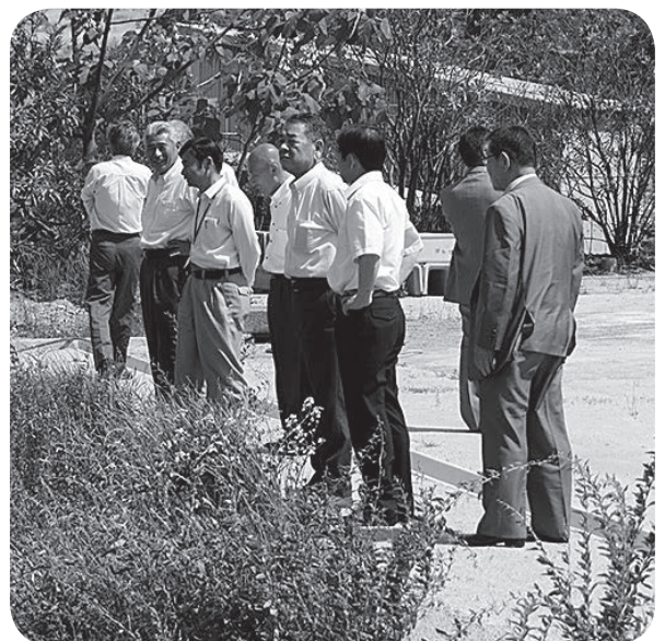
動物焼却炉移設予定地