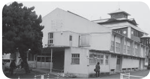
解体する東部公民館