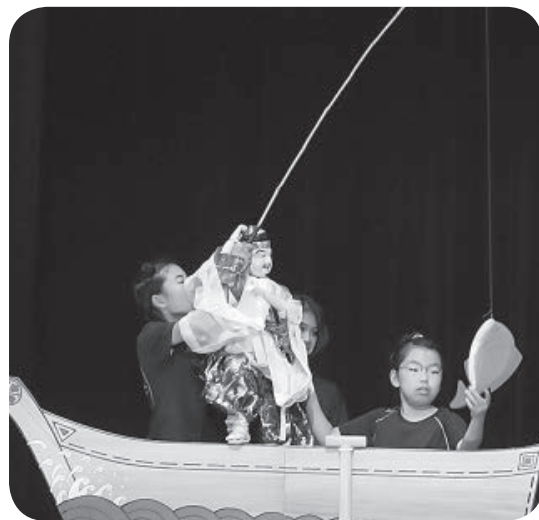
つつた つつた おつきいど!