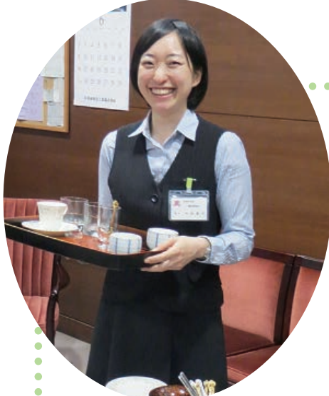
気さくな人ばかりで……