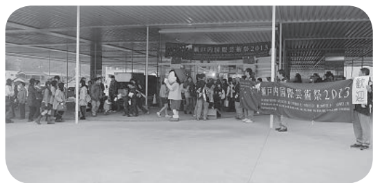
混雑が回避された宮浦港