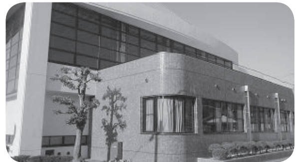
無料で利用できる西部公民館