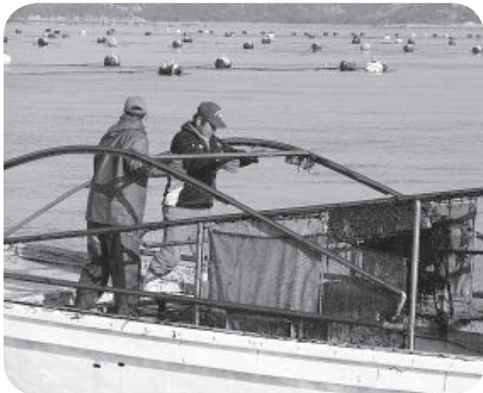
頑張っている地場産業

町民の皆様が物心ともに豊かで、健康そして安心と幸せを実感し、温もりと活力ある町づくりを基本方針とし、依然として厳しい財政運営を強いられる状況の中、国の景気対策に配慮しながら、離島振興法をはじめ国・県の補助制度等や有利な町債を活用するなど、限られた財源で最大の事業効果を発揮するよう、町の発展・活性化を推進することを基本とした予算編成としました。