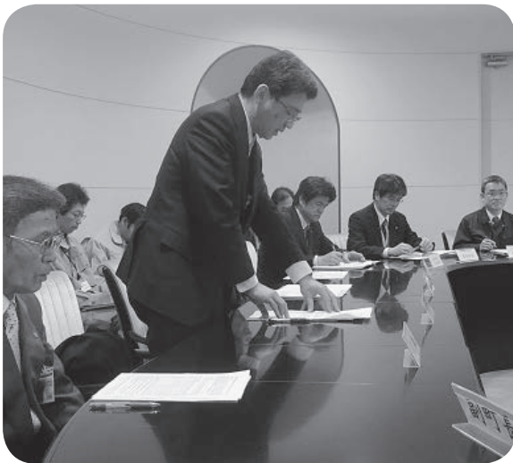
あいさつされる工代部長

最後に、汚染土壌処理も直島の中間処理事業同様、安全第一で無事終了するよう県に要望しました。