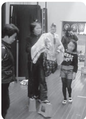
高ゲタをはいて、キンチョー

成田 重たい人形を上手に動かせるようになったね。全員で力を合わせて「えびす舞」を仕上げてください。見てもらいましょう。