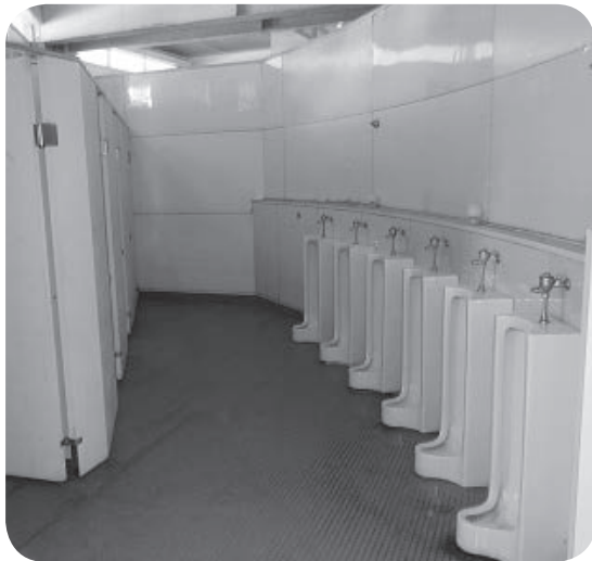
改修前の中学校体育館トイレ