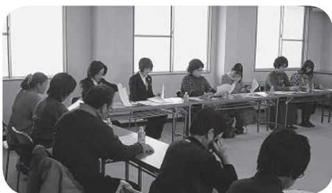
外国人観光客へのおもてなし研修

○1月28日 おもてなし研修が商工会館で開催された。参加者は20人、外国人観光客にどう接するか熱心に研修した。