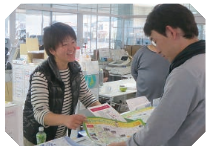
結構忙しいんですよ

A 趣味はフットサルです。旅行やバイクで出掛けるのも大好きです。あとは、のんびり本を読んだり、散歩をしたりして過ごしています。