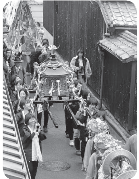
町内を練り歩く「みこし」

にデータを流してくれているとのことだが、直島にはその測定器はないのか。なければ設置する気はあるのか。