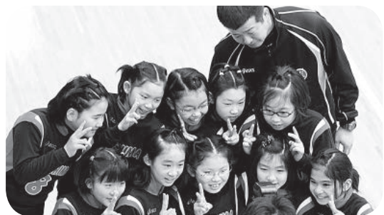
よくがんばったジュニアバレーボールクラブ