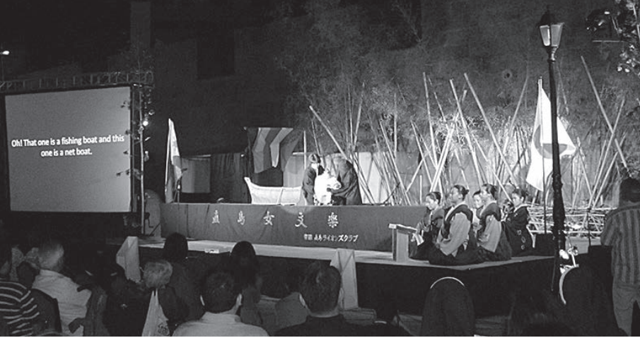
フィリピンの学生たちと共演