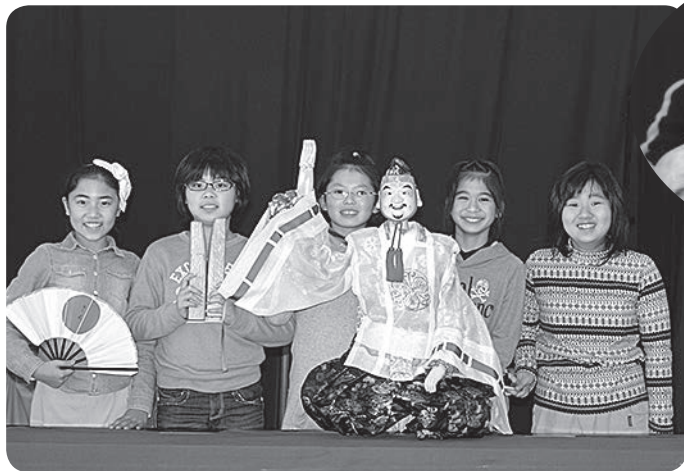
えびすさんと「はい チーズ!」