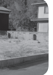
購入した横防土地