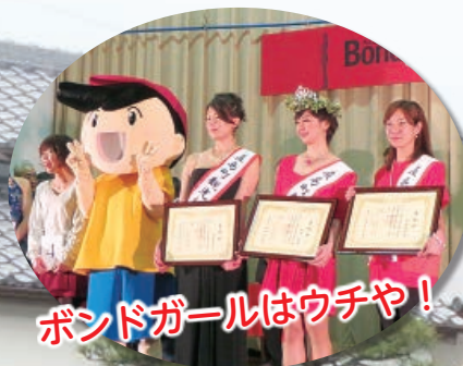
ポンドガールはウチや!

発行●香川県直島町議会 編集●議会広報編集特別委員会 電話●(087)892-2297 印刷●山陽印刷(株)