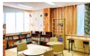
西部公民館図書室（2階）