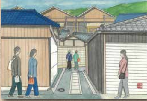
横防 岡崎 貢さんの作品 「追出に新しい建物が」