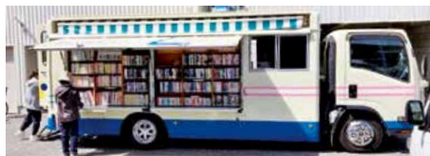
移動図書館「ララ号」

高松市移動図書館と香川県立図書館を町内で利用できます。町内で利用できる図書館などについてお知らせします。また、西部公民館図書室（2階・新着図書も続々入荷！）もありますので、ぜひご利用ください。