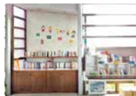
香川県立図書館（役場ロビー）