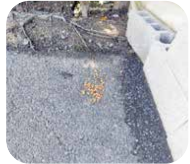
ばら撒かれたエサ

野良猫に餌を与えることは、飼い主と同等の責任が伴うことを理解し行動してください！