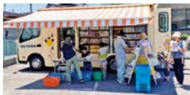
移動図書館「ララ号」（西部公民館駐車場・役場倉庫前）

天満屋ハピータウンメルカ2階にあります。直島町民も本を借りることができます。新規の場合は図書館カードを作成するために免許証や保険証など、住所を確認できるものが必要です。