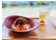
せとぼん 650円とオリブ牛のステーキビラフ 1,080円

営 3~9月 10:30~17:45 (L.O. 17:30) 10~2月 10:30~16:45 (L.O. 16:30)