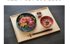
牛 GYU ローストビーフ丼 2,800円