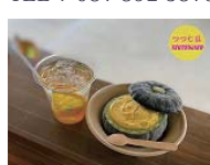
かぼちゃアイス 800円 直島限定せとぼん 650円