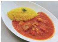
オリブ豚のトマト煮込み 1,250円