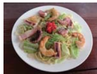
直島塩やきそば 900円

営 11:00 ~ 13:30 17:00 ~ 21:00 (L.O. 20:30)