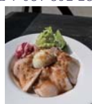
オリブ豚のローストポーク丼 (1100円)