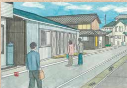
横 防 岡崎 貢さんの作品 「何の店だろう」