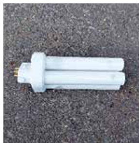
コンパクト型蛍光灯